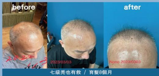
七級禿也有救 / 育髮8個月