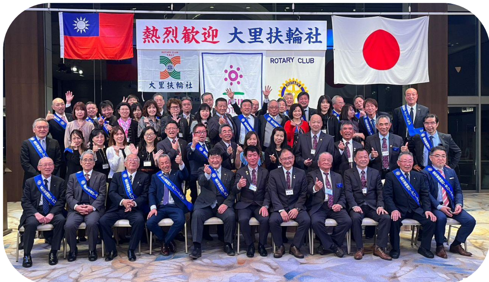
訪問日本富士吉田西姊妹社!!