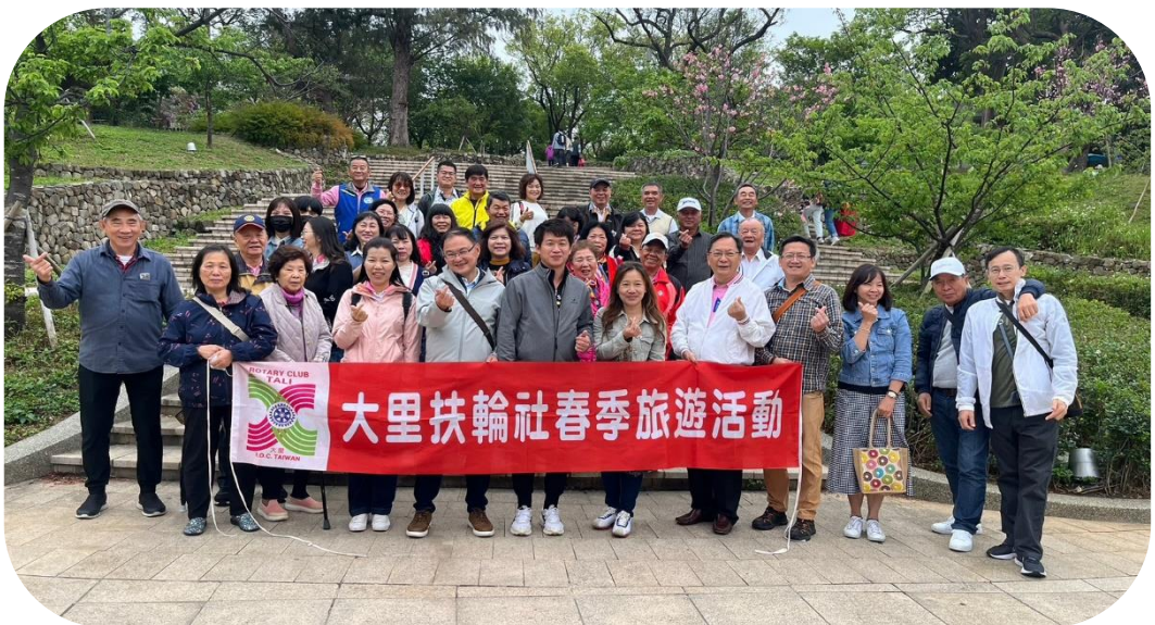
春游大家開心的模樣!!