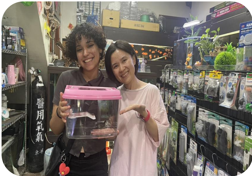
小葳收到社長夫人的禮物!!