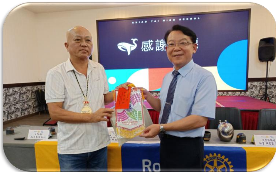
僑泰高中-溫校長捐贈出席費