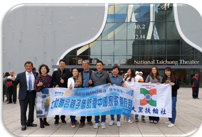
七社聯合親子活動-參訪國家歌劇院