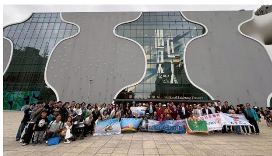
七社親子活動-參訪國家歌劇院