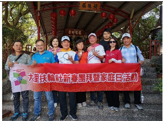
新春團拜暨登山健行家庭日