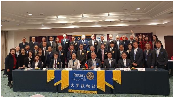
日本富士吉田西姐妹社歡迎會活動