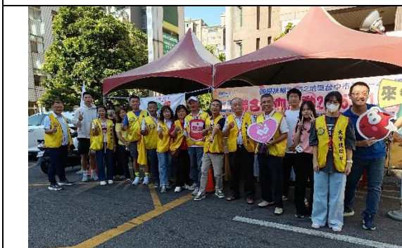
七社聯合捐血活動