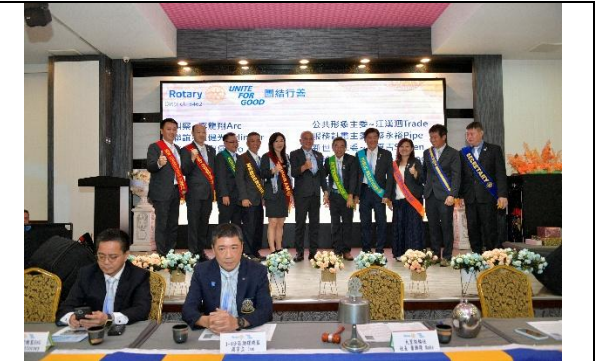
社長暨職員就職典禮