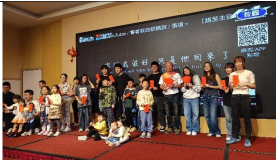
新春團拜暨登山健行家庭日