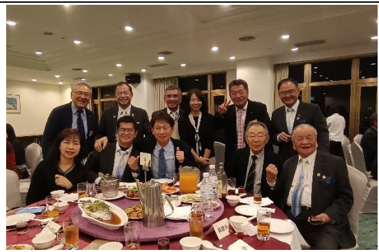
日本富士吉田西姐妹社歡迎會活動