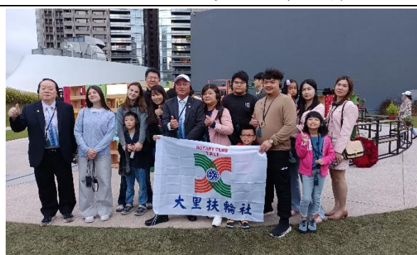
七社親子活動-參訪國家歌劇院