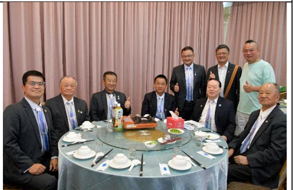
社長暨職員就職典禮