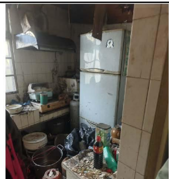
廚房雜物堆積已經沒有在使用