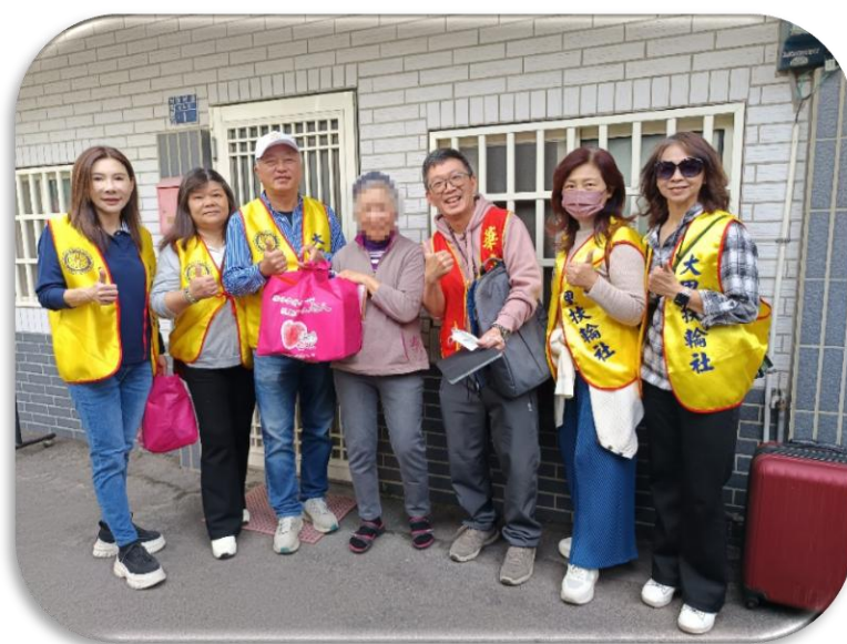
與華山基金會一起走訪社區老人致贈年菜