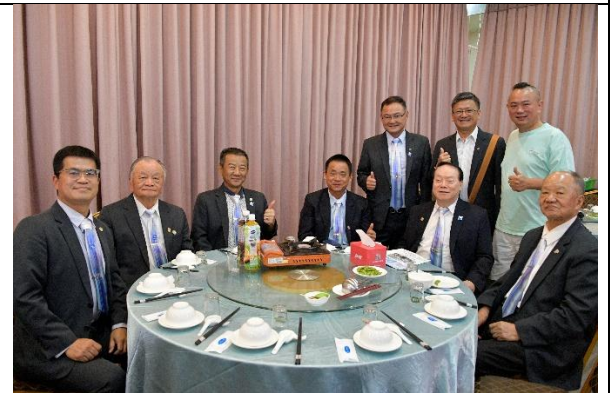
社長暨職員就職典禮